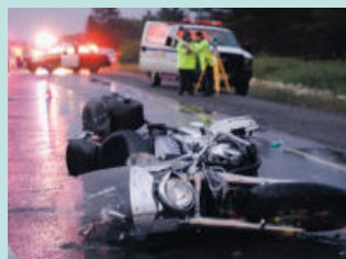
오토바이 사고 Motorcycle Accidents