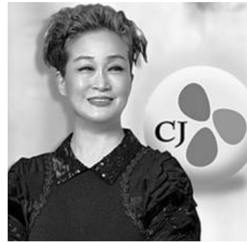
▲ '올해의 국제 프로듀서'로 선정된 이미경 부회장.

이미경 CJ 부회장이 미국 연예 잡지 할리우드리포터(THR)가 선정한 올해의 국제 프로듀서로 선정됐다.