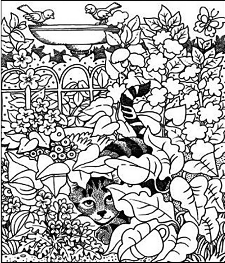
© 위의 그림에 숨어있는 아래 그림을 찾으며 영어 단어도 익혀 보세요. (해답은 P45에 있습니다.)