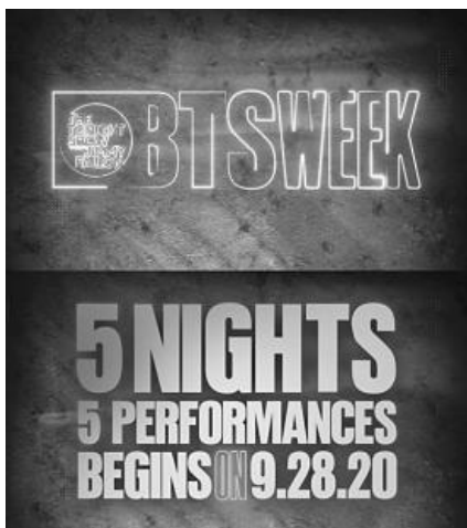
▲ 미국 '팸런쇼' 방탄소년단 특별 편성 예고 사진.

지난 23일 소속사 빅엔터테인먼트는 "미국 NBC '더 투 나잇 쇼 스타링 지미 팸런' (이하 팸런쇼)가 9월 28일(월)부터 10월 2일(금)까지를 'BTS 주간' (BTS Week)으로 명명하고, BTS가 닷새간 연속 출연하는 특별 방송을 진행한다."며 " '팸런 쇼'에서 특정 아티스트를 위한 주간 기획을 편성하는 건 매우 이례적"이라고 전했다.