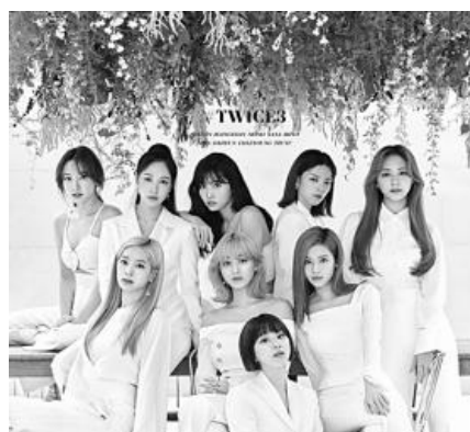
▲ 트와이스 일본 베스트3집 표지 사진. 사진=JYP엔터테인먼트

결그룹 트와이스가 일본에서 낸 베스트 앨범으로 오리콘 주간 앨범 차트 정상에 올랐다.