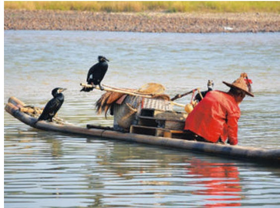
▲ 중국 리강에는 가마우지를 이용해 물고기를 잡는 어부들이 있다.

낚시를 하는 새도 있다. 일본의 해오라기는 빵이나 과자로 물고기를 낚는다. 공원의 연못에 사는 잉어들은 사람이 과자나 빵을 던지면 수면 위로 올라온다. 해오라기는 이 모습을 보고 빵 조각을 물어다 수면 위에 떨어뜨린 후 올라오는 물고기를 잡아먹는다. 빵이 없으면 작은 곤충을 이용하기도 한다.