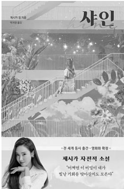
▲ 제시카의 자전적 소설 '샤인' 표지.

그룹 ‘소녀시대’ 출신 제시카가 자전적이야기를 담은 소설 ‘샤인’을 출간한다.