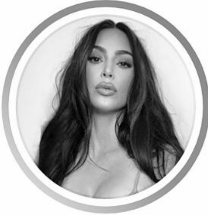
▲ 김 카다시안

미국의 유명 방송인이자 모델, 사업가인 김 카다시안이 잠정적으로 페이스북과 인스타그램 활동 중단을 선언했다.