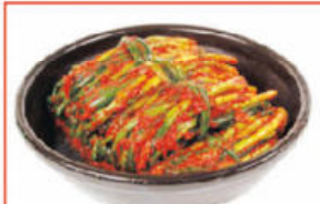
봉화 청량산 파김치 $35 2kg