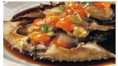
통영꽃게 간장게장 2.2LB (3~4마리)