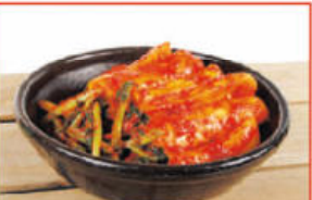
봉화 청량산 총각김치 $30 5kg