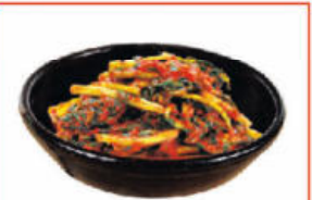
봉화 청량산 열무김치 $30 3kg