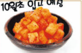
봉화 청량산 깍두기 $15 2kg