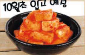
봉화 청량산 석박지 $20 2kg