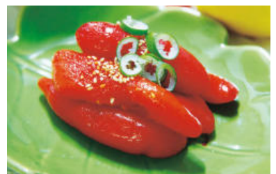
명란젓 특A급 1LB