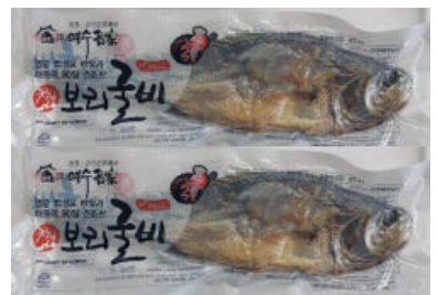
영광보리굴비 특대 사이즈 1마리