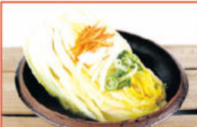
봉화 청량산 백김치 $25 4kg