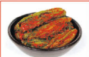
봉화 청량산 갓김치 $28 2.5kg