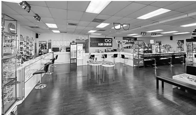
▲ <딘스안경> 매장 전경.

<딘스안경>은 손님의 안전에 보다 힘쓰며 모든 안전 규정에 모범적으로 대처하면서 빠른 성장세를 보이고 있다. 안경원에 출입 전 열 체크와 소독, 장갑과 마스크 등을 제공해 위험을 차단하고 2,300sqft. 크기의 넓은 매장은 사회적 거리두기에 특히나 유리하면서도 고객 쇼핑에 충분한 자유도를 선사하고 있다.