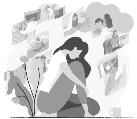
* 한국에서 중학교 1학년을 마치고 미국으로 건너와 26년 동안 생활했던 필자는 2017년 8월부터 다시 한국에서 생활하고 있다. '나는야 1.5세 아줌마'는 '재미교포1.5세 아줌마'인 필자가 한국 생활을 하면서 전하는 생생하고 유쾌한 한국 이야기이다. <편집자 주>

이렇게 그대가 들리지 않을 말들을 그대가 들었으면 사랑이란 맘이 이렇게 남는 건지 기억이란 사랑보다 더 슬퍼