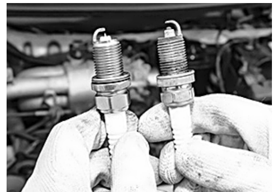
▲ 신제품 점화플러그(왼쪽)와 손상된 점화플러그.

의한 오염을 의심해봐야 하는데, 일반적으로 혼합비 불량, 에어 클리너 막힘, 낮은 열가의 플러그를 장착했을 경우 등이 해당된다. 또한 전극 부위에 끈적한 오일이 묻어 있다면 엔진 오일이 너무 많거나 피스톤 링, 실린더 등의 마모가 심해 엔진 오일이 연소실로 과도하게 유입되는 경우이다.