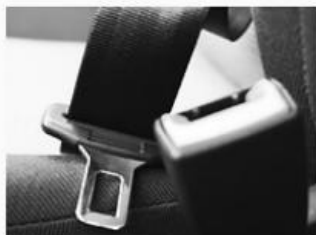
안전벨트 결함 Defective Seatbelts