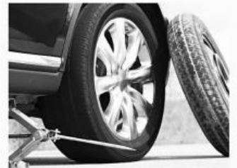
타이어 결함 Defective Tires