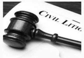
민사 소송 Civil Litigation