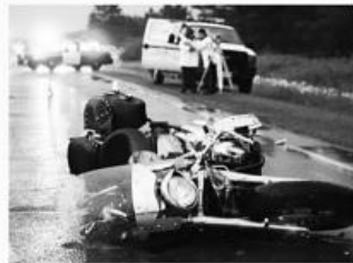
오토바이 사고 Motorcycle Accidents