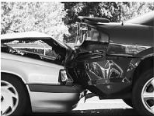
교통 사고 Auto Accidents

대기업들을 상대로한 수백만 달러 가치의 타이어 결함, 차량전복, 지붕파손 및 제품결함 책임관련 소송들을 성공적으로 이끌어냈습니다.