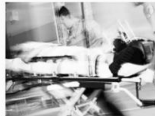
심각한 부상 Serious Injuries