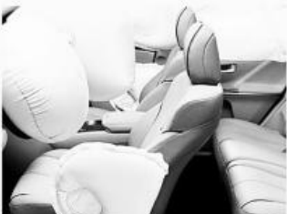
에어백 결함 Defective Airbags