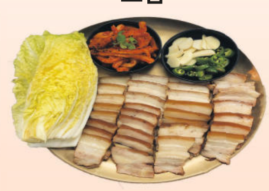
질좋은 삼겹살 + 허브