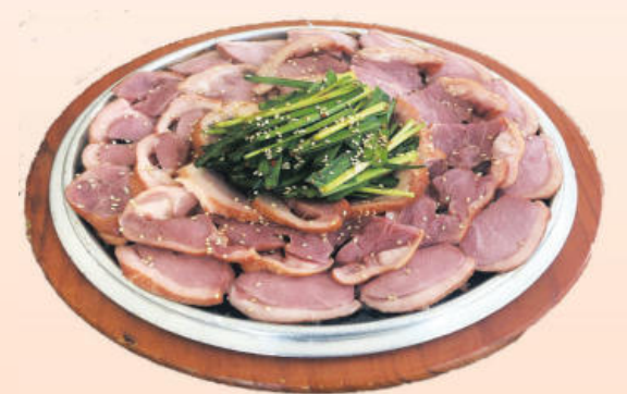
참나무숯으로 훈연시킨 오리로 만든 웰빙요리