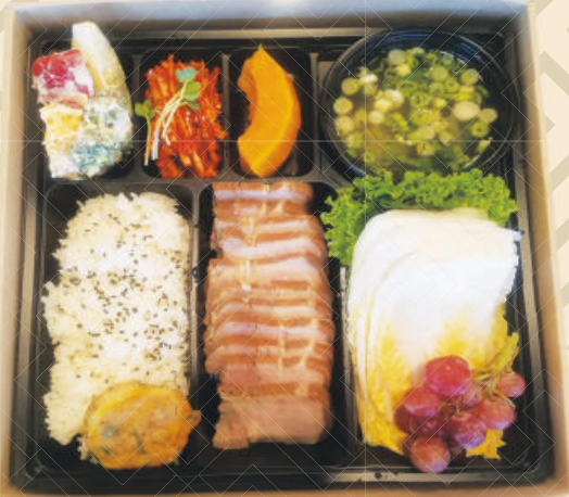
반찬은 매일 다른 신선한 메뉴로 제공합니다