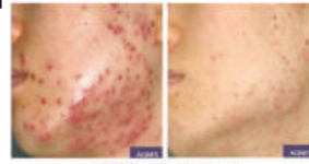
AGNES - Acen Treatment