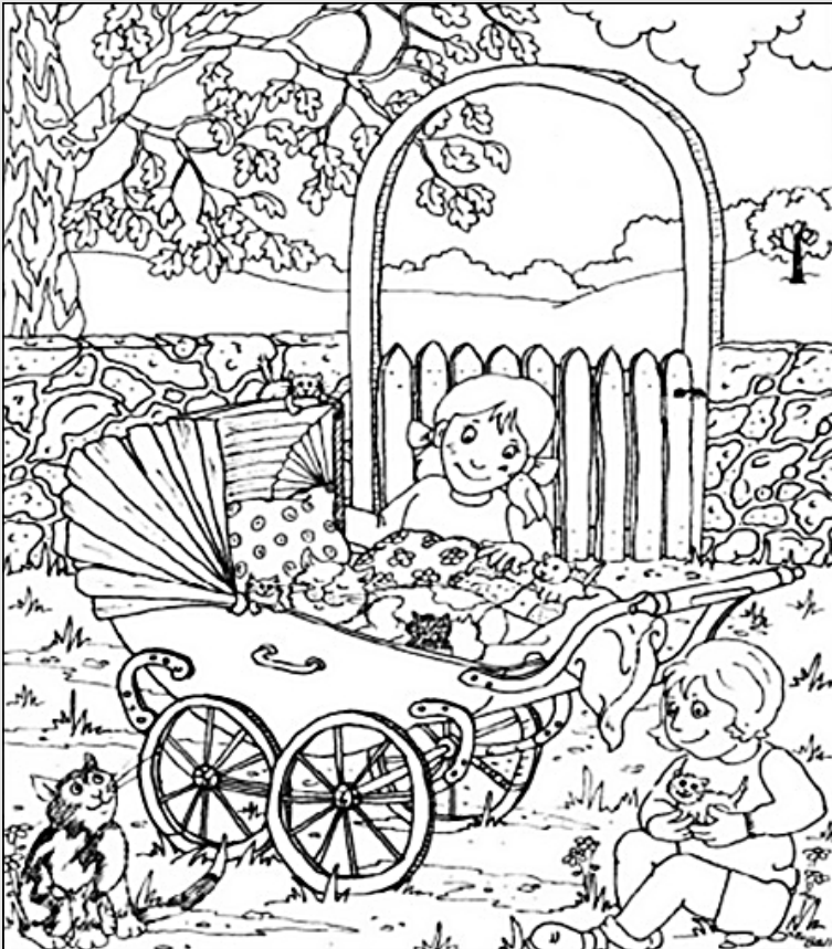
© 위의 그림에 숨어있는 아래 그림을 찾으며 영어 단어도 익혀 보세요. (해답은 P43에 있습니다.)