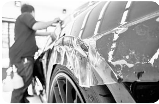
▲ PPF 부착 작업 모습.

처음 구입한 새 차를 처음 모습 그대로의 외관 유지를 위해 유리막 코팅 혹은 자동차 보호필름 부착을 하기도 한다.