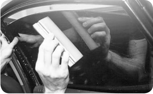
▲ 자동차 창문 틴팅 작업 모습.

많은 사람들이 차를 구입하고 창문 틴팅을 한다. 틴팅은 자외선으로부터 운전자나 탑승자의 눈과 피부도 보호해 주고, 자동차 시트 등을 보호해 준다. 틴팅은 연비 절감의 효과도 있다.