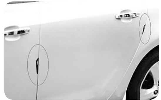
▲ 자동차 도어 가드를 장착한 차량 모습

주차 후 자동차 문을 열다 부주의로 옆에 주차된 차를 받는 경우가 있다. 내 차나 받힌 차나 훼손되지 않았다면 다행이지만 특히 받힌 옆 차에 흠집이 남는 경우도 있다. 이럴 때를 대비해 문콕 방지 도어 가드(프로텍터)를 장착하면 좋다. 미국에서는 자동차 도어 가드를 장착한 차량을 발견하기 쉽지 않지만 다른 차를 위한 배려를 실천한다는 측면에서 내가 먼저 장착해도 좋을 듯하다. 온라인에서 다양한 형태의 도어 가드를 쉽게 구입할 수 있다.