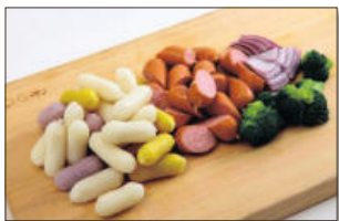
1. 치즈떡은 한 번 헹귀 물기를 빼서 준비하고, 비엔나 소시지는 먹기 좋게 2등분 하고, 양파는 2x2cm 크기로 썰고, 브로콜리도 먹기 좋게 썬다.

◆ 주재료: 치즈떡(300g), 비엔나 소시지(10개), 양파(4분의 1개-50g), 브로콜리(1줌-50g), 체다슬라이스치즈(1장) ◆ 크림소스 재료: 생크림(1컵), 우유(1컵), 파르마산 치즈가루(2), 청양고추(1개) ◆ 양념재료: 올리브유(1), 다진 마늘(1), 소금(0.2), 통후추 간 것(적당량)