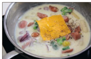
5. 떡이 말랑하게 익으면 체다슬라이스 치즈를 넣고 맛을 보아 소금, 통후추 간 것을 넣어 주면 끝!!