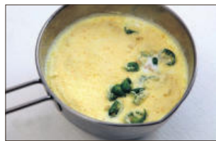
2. 크림소스재료 분량대로 생크림, 우유, 파르마산 치즈가루, 송송썬 청양고추를 넣고 구워 섞는다.