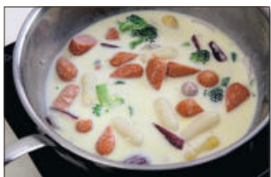
4. 미리 만들어 놓은 크림소스를 붓고, 불의 세기를 세게 하여 바글바글 끓기 시작하면 중불로 줄여 3-4분간 떡이 푹 익을 때까지 더 끓인다.