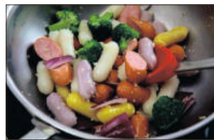
3. 중약불로 달군 팬에 올리브유를 두르고, 다진 마늘과 양파를 넣고 볶다가 치즈떡과 비엔나 소시지, 브로콜리를 넣고 1분간 더 볶는다.