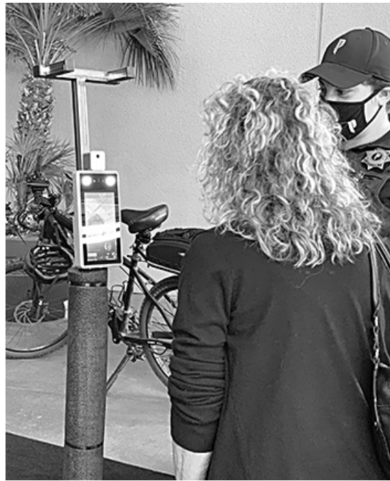
▲ Pechanga 입구에 설치된 입장객 체온 관련 안내문(위)과 입장 전 체온 검사를 받고 있는 고객

<Pechanga 리조트 카지노>측은 과거와 달라진 운영 방식과 방문객들이 지켜야할 규칙들도 소개했다. ● 개장 초기 단계 동안 실내 흡연은 금지된다.