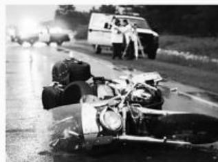
오토바이 사고 Motorcycle Accidents