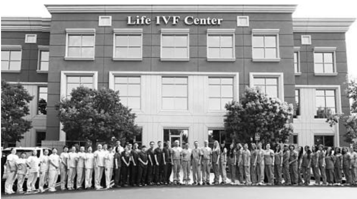
▲ <Life IVF Center> 빌딩 앞에 모인 <Life IVF Center> 팀원들

난임 혹은 불임으로 고통받는 부부들이 있다. 이들에게 <Life IVF Center>는 한줄기 희망을 선사할 수 있다. IVF는 'In vitro fertilization' 의 약자로 체외수정 즉, 시험