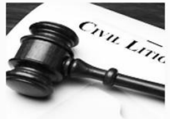
민사 소송 Civil Litigation