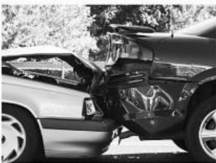
교통 사고 Auto Accidents

대기업들을 상대로한 수백만 달러 가치의 타이어 결함, 차량전복, 지붕파손 및 제품결함 책임관련 소송들을 성공적으로 이끌어냈습니다.