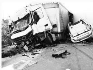
트럭 사고 Truck Accidents