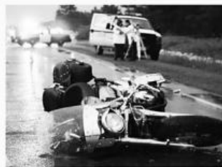
오토바이 사고 Motorcycle Accidents