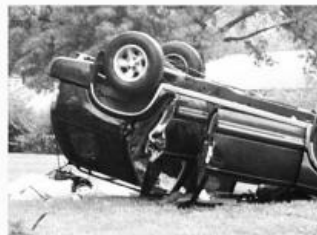
지붕파손 / 차량전복 Roof Crush / Roll Overs