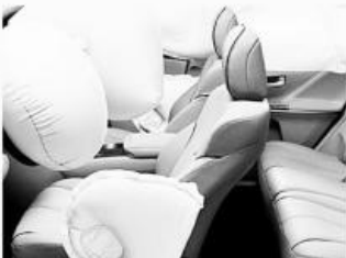
에어백 결함 Defective Airbags