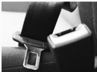
안전벨트 결함 Defective Seatbelts