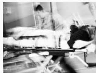
심각한 부상 Serious Injuries