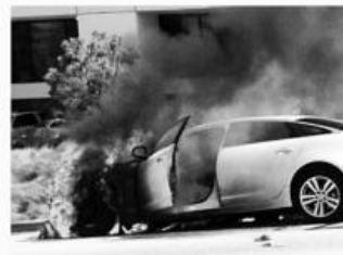
차량 화재 Car Fires