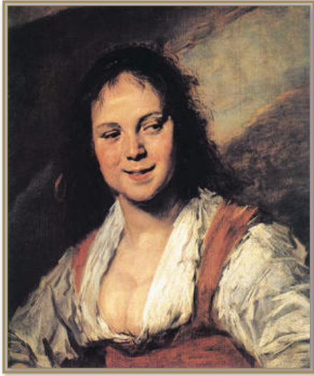
집시 소녀 (Gypsy Girl c. 1628-1630)

프랑스 할스 (Frans Hals 1583 - 1666) (캔버스에 유채 58 cm x 52 cm 파리 루브르 미술관)