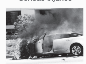
차량 화재 Car Fires