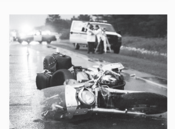
오토바이 사고 Motorcycle Accidents