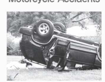
지붕파손 / 치량전복 Roof Crush / Roll Overs