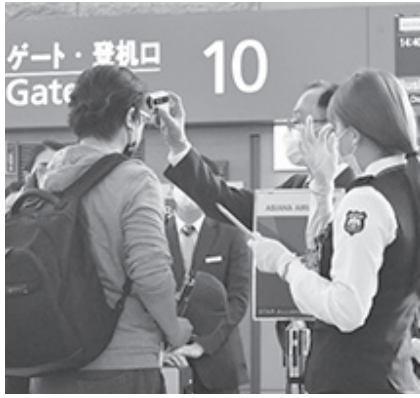
▲ 인천국제공항 제1여객터미널 탑승 게이트 앞에서 미국행 항공기 탑승객들이 발열 검사를 받고 있다

신종 코로나바이러스 감염증(코로나 19) 확진자수 급증으로 한국인에 대한 입국 제한 조치를 취하는 국가가 늘어나는 가운데 인천공항에서 출국할 때 출발증을 거쳐 항공기에 탑승할 때까지 3단계의 발열 검사가 이뤄진다.