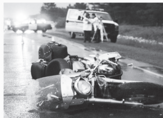
오토바이 사고 Motorcycle Accidents