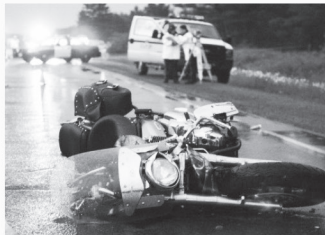
오토바이 사고 Motorcycle Accidents