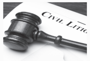
민사 소송 Civil Litigation