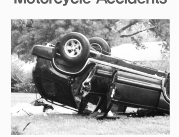
지붕파손 / 차량전복 Roof Crush / Roll Overs