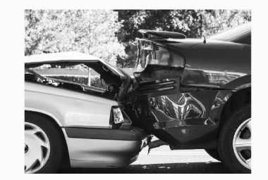
교통 사고 Auto Accidents

UC IR WINE / BACHELOR OF ARTS MCGEORGE SCHOOL OF LAW TURIS DOCTORATE