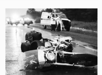
오토바이 사고 Motorcycle Accidents