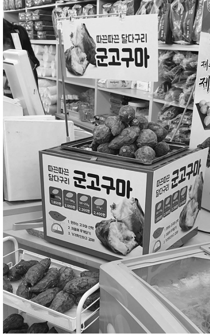
▲ 이달 중순 군고구마 매출이 호빵을 제치고 편의점 겨울 간식 매출 1등을 차지했다.

편의점에서 군고구마 인기가 높아진 이유로는 길거리 군고구마가 원재료 가격 상승으로 경쟁력을 잃고 점차 자취를 감추며 편의점이 이를 대체하게 됐고