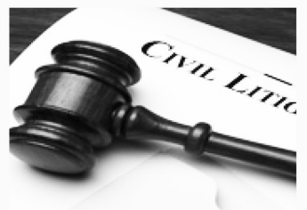
민사 소송 Civil Litigation