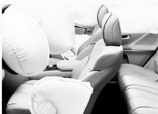
에어백 결함 Defective Airbags