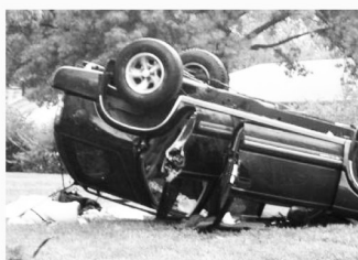
지붕파손 / 차량전복 Roof Crush / Roll Overs