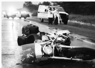
오토바이 사고 Motorcycle Accidents