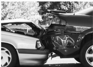
교통 사고 Auto Accidents

대기업들을 상대로한 수백만 달러 가치의 타이어 결함, 차량전복, 지붕파손 및 제품결함 책임관련 소송들을 성공적으로 이끌어냈습니다.