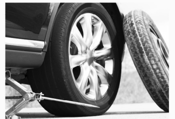
타이어 결함 Defective Tires