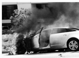
차량 화재 Car Fires