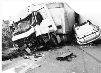
트럭 사고 Truck Accidents