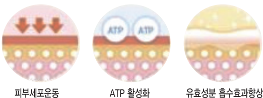
피부세포운동 ATP 활성화 유효성분 흡수효과향상

Pastelle Toning (미백 토닝) x 3회 + Genesis Laser x 3회 with Carbon peel + Organic Soothing Mask x 3회 + 딜렉스 스킨케어 x 3회 + Micro Current 미세전류 리프팅 x 3회 + 즐기세포 앰플 x 3회