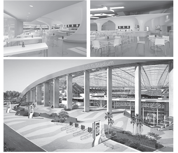
▲ ‘스타디움’ 안에 들어설 Pechanga 파운더스클럽 (Founders Club · 위)과 ‘소피(SoFi)스타디움’ 주출입구 조감도(아래)

한편 Pechanga는 연말연시를 맞아 잉글우드에 있는 모닝사이드고등학교와 스쿨 온 휠스 (School on Wheels), 재향군인 단체인 U.S. Vets의 잉글우드 지부에 $100,000를 기부했다. Pechanga는 잉글우드뿐만 아니라 남가주 전역에 있는 여러 지역 커뮤니티들에 그간 수