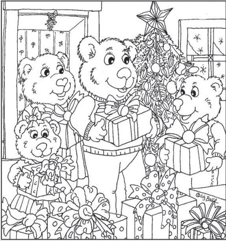
◎ 위의 그림에 숨어있는 아래 그림을 찾으며 영어 단어도 익혀 보세요. (해답은 P53에 있습니다.)