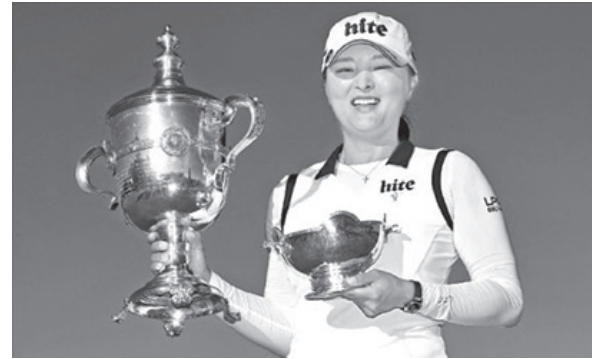
올해 메이저 대회에서 두 차례(ANA 인스퍼레이션, 에비앙 챔피언십) 우승하고 지난 8월에는 114개 홀 연속 보기 없는 플레이를 하는 등 최강자로 자리매김했다.

고진영은 이날 경기를 마친 뒤 "엄청난 상을 받게 돼 영광" 이라면서도 "오늘 퍼팅이 말을 안 들어서 아쉬운 라운드를 했던 것 같다. 조금 더 연습을 더 하라는 뜻인 것 같다" 고 말했다.