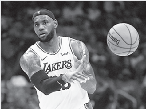
르브론(사진)이 진기한 기록을 세웠다.

르브론은 지난 23일 멤피스 그리즐리스와 2019-20 NBA(미국 프로 농구) 정규 시즌 원정경기에서 30점 6리바운드 4어시스트 FG 51.9%로 펄펄 날며 팀 승리를 이끌었다.