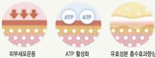
피부세포운동 ATP 활성화 유효성분 흡수효과향상

세포에 접촉해서 생체전류와 유사한 미세전류 자극으로 세포운동을 유도하여 피부 속 부터 되살아나도록 도와줍니다.