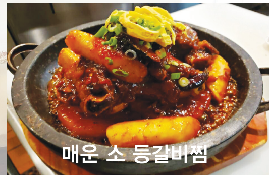
매운 소 등갈바찜