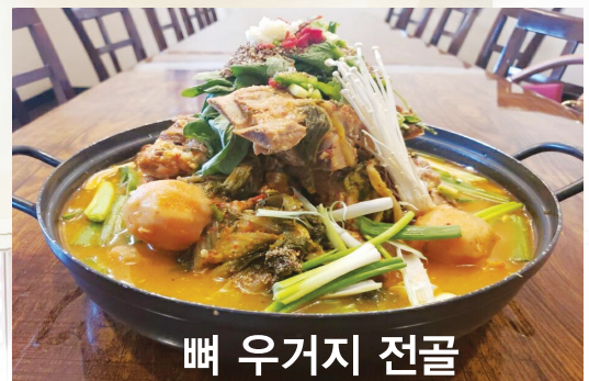
뽕 우거지 전골