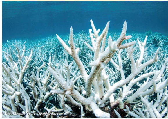
▲ 기후변화로 하얗게 변해 죽어가는 호주의 대산호초지대

산호는 난자와 정자를 체외로 배출해 바닷물 속에서 수정한다. 둘 다 몇 시간 동안만 바닷물에서 생존할 수 있기 때문에 난자와 난자와 비슷한 시기에 방출되는 것이 산호의 번식에 중요하다. 이런 동시성은 해수 온도, 태양 복사, 바람, 달의 위상 및 일몰 시간과 같은 환경 요인에 크게 영향을 받는다. 그런데 지구온난화에도 인간의 남획까지 겹쳐 산호가 점점 사라져가고 있다. 최근 세계에서 가장 큰 산호초 군락인 호주 '그레이트 배리어 리프'의 산호초 반이 사라졌다는 연구 결과가 나왔다. 지구온난화가 지속되면 2100년