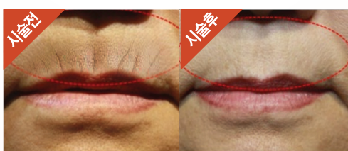
얼굴 나이를 올리는 입가주름! 최신기계 도입으로 깊은 주름 이제 안녕~