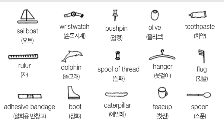
■ 이미지 출처: www.pinterest.com