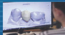
자체 기공소 보유

USC, UCLA 치과대학을 졸업한 치의학 박사님들이 20년 이상의 풍부한 임플란트 수술 경험과 의술로 여러분을 모십니다