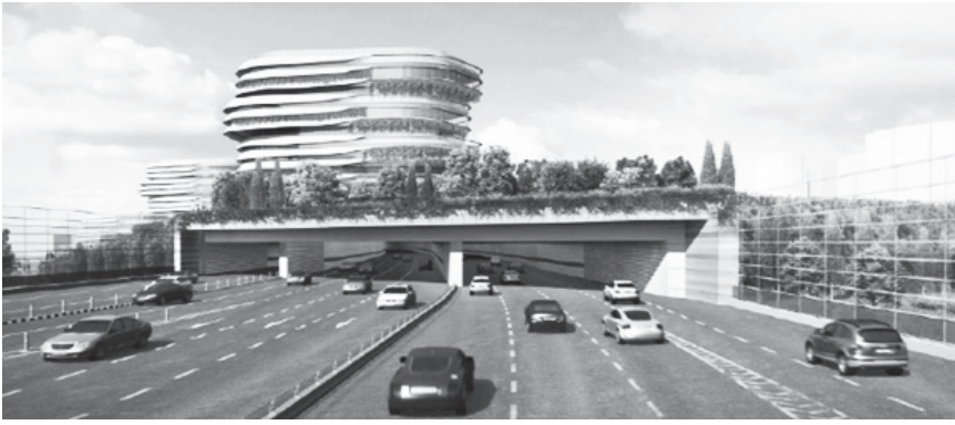
▲ 북부간선도로 상부 인공대지 조성 후 단절된 지역의 연결 복원 예상도

서울 북부간선도로 위에 공공주택 1천채를 짓겠다는 서울시의 구상이 본격화한다.