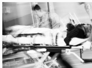
심각한 부상 Serious Injuries