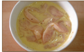
3. 밑간을 한 닭에 튀김옷 재료인 달걀, 녹말가루를 넣고 휘휘 섞어 준다.