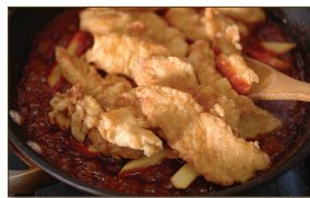
6. 미리 튀겨 놓은 고구마와 닭을 넣고 양념이 골고루 묻도록 버무려 주면 끝.

※ 튀김은 2번 튀겨야 바삭하답니다. 일단 한번 튀긴 것을 조금 두었다가, 튀김에서 살짝 물이 배어나오면 그때 아주 뜨거운 기름에 한번 더 튀겨내는 것이 요령이지요.