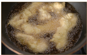
4. 달걀 튀김 기름에 고구마를 먼저 넣어 튀겨 한쪽에 두고 이어서 튀김옷을 입힌 닭을 넣고 바삭하게 2번 튀긴다.