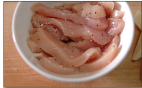
2. 닭고기는 닭밑간 재료인 소금, 후춧가루, 청주를 넣어 잠시 재워 둔다.