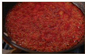
5. 팬에 소스 재료인 고추장, 케첩, 맛술, 물엿, 물, 다진 마늘, 생강가루, 후춧가루를 함께 넣고 바글바글 끓인다.