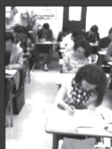
▲ LA강의 모습