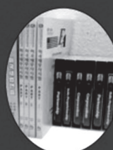
▲ 세무사 시험 준비 교재 (96% 이상 적용 교재)

트럼프 세제 개혁을 반영한 신교재로 강의 - 7월부터 개정세법이 시험에 출제