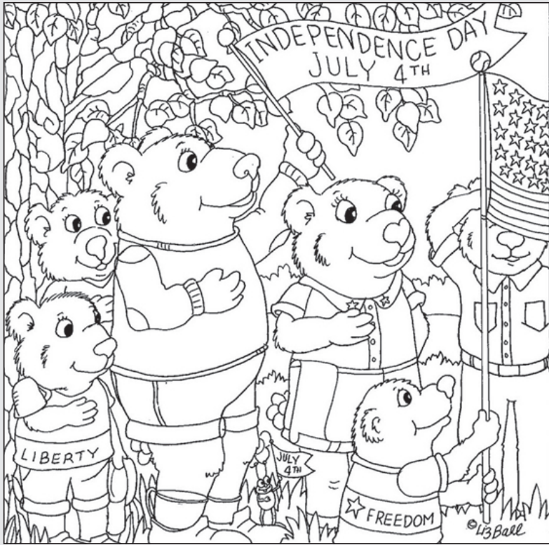
© 위의 그림에 숨어있는 아래 그림을 찾으려 영어 단어도 익혀 보세요. 어린 자녀들의 색칠하기 놀이 자료로도 아주 좋아요. (해답은 P40에 있습니다.)