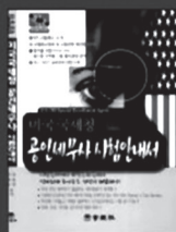
▲ 세무사 시험 안내서

“학력, 전공, 신분 상관없이” 누구나 2달이면 합격 100% 합격 보장