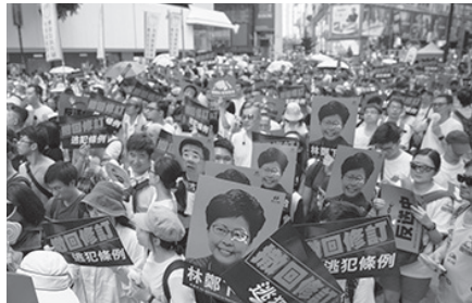
▲ 지난 9일 홍콩에서 열린 '범죄인 인도 법안' 반대 시위에 100만 명 이상의 시민들이 참여했다.

로 징역형이 선고됐고, 홍콩 독립을 주장하는 홍콩민족당은 강제로 해산됐다.