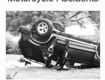
지붕파손 / 차량전복 Roof Crush / Roll Overs