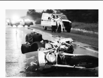
오토바이 사고 Motorcycle Accidents