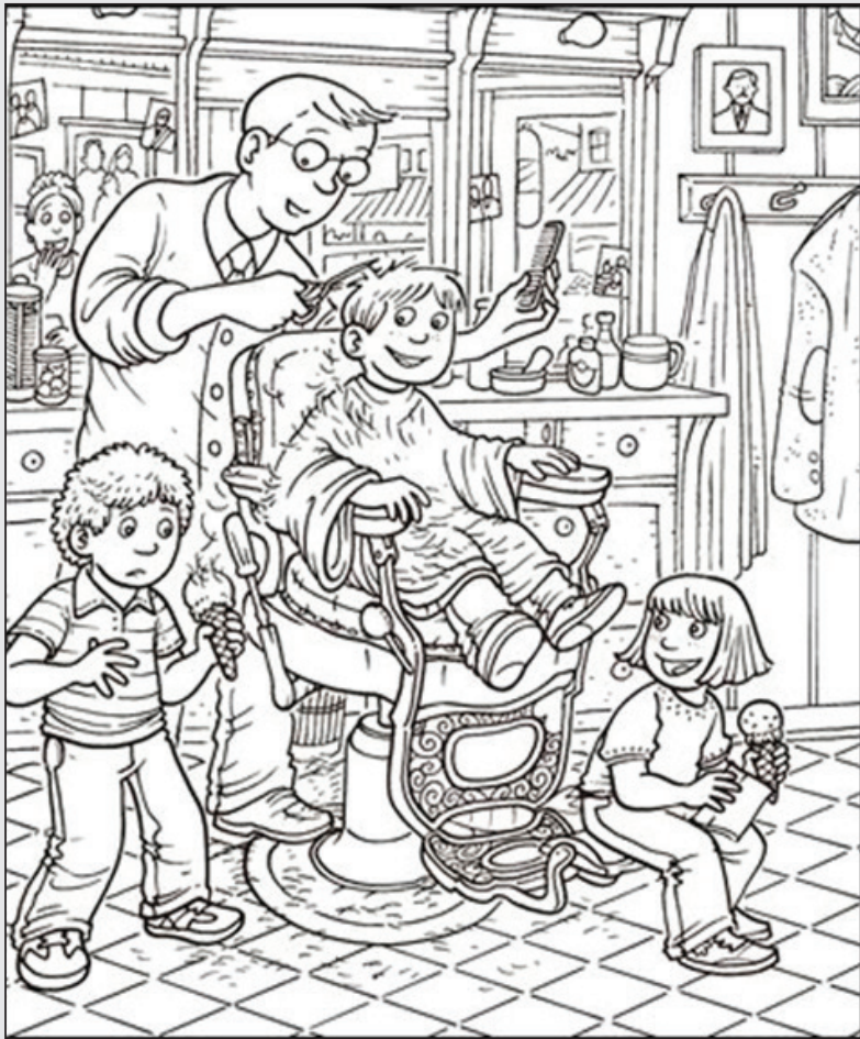
© 위의 그림에 숨어있는 아래 그림을 찾으며 영어 단어도 익혀 보세요. 어린 자녀들의 색칠하기 놀이 자료로도 아주 좋아요. (해답은 P44에 있습니다.)