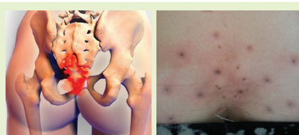
꼬리뼈가 상한 분은 검은 독소가 터져 나온다.

2. 변실금도 항문 및 꼬리뼈의 독소를 없애줘야 합니다. 삽입형을 쓰면 대개 1~3달 이면 조여지게 됩니다. 그래도 잘 안되는 분은 꼬리뼈 속의 독소를 뽑아줘야 합니다. 심한 분은 검은 독소가 나옵니다.