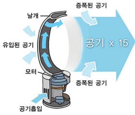
▲ 날개 없는 선풍기의 원리를 나타낸 그림

곧 다칠 더위에 대비해 창고에 보관하고 있던 선풍기를 꺼낼 때가 됐다. 사용 전에는 커커이 쌓인 먼지를 닦아내야 한다. 선풍기 날개에 달라붙어 있는 먼지를 털어내기 위해서는 안전망을 제거해야 하는 번거로움도 감수해야 한다. 그래도 더위로 고생하는 것보다는 낫다. 선풍기가 작동하고 있을 때에는 안전사고에도 각별히 유의해야 한다. 어린아이가 있는 집이라면 특히 더 그렇다.