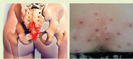
꼬리뼈가 상한 분은 검은 독소가 터져 나온다.

2. 변실금도 항문 및 꼬리뼈의 독소를 없애줘야 합니다. 삽입형을 쓰면 대개 1~3달 이면 조여지게 됩니다. 그래도 잘 안되는 분은 꼬리뼈 속의 독소를 뽑아줘야 합니다. 심한 분은 검은 독소가 나옵니다.